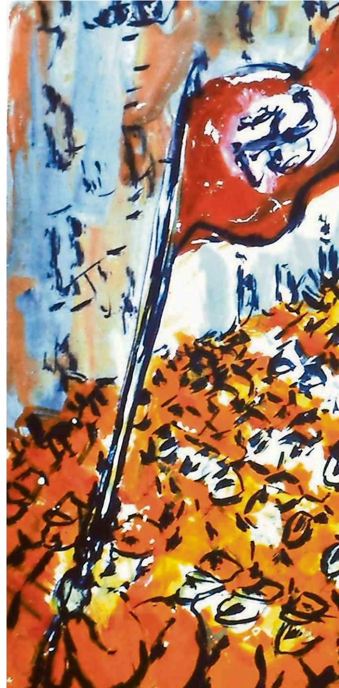
De massa marcheert achter de vlag met het hakenkruis.